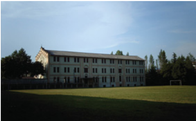
Altsasuko Kaputxinoen komentuko ikastetxea eta futbol zelaia