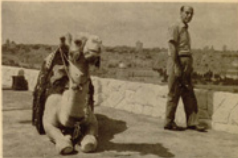
Jerusalem' inguruan Uri Saizidua, kamelillo, espaltetan, Mektizen... (Caption text is partially obscured)

Gizonari buruko neurria berru nai dituen denbora auzan, ez da