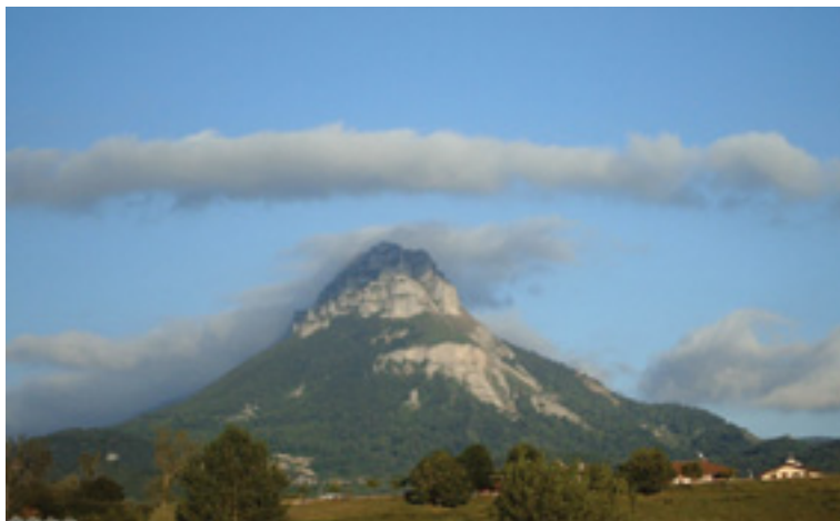
Beriaín mendia Etxarri ingurutik ikusita