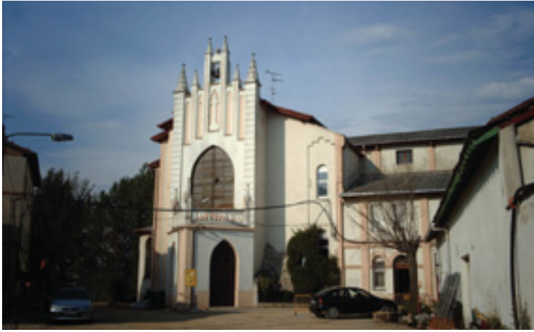
Altsasuko Kaputxinoen komentuko eliza