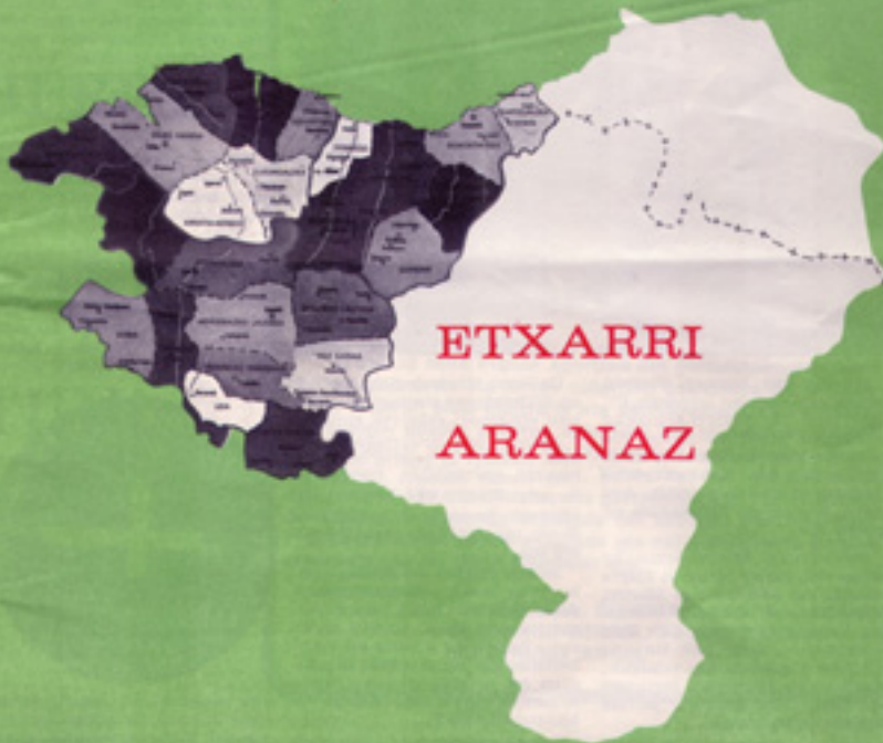
Goiz-Argi aldizkariaren ale baten azala