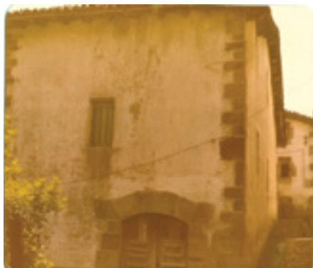
Xantuaren etxea ( Xantubaan ) Santiago Ezkerraren sortetxea zenaren atzeko alde