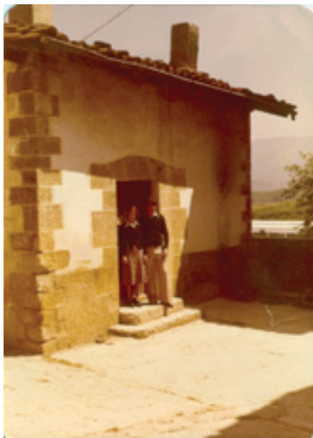
Xantuaren etxea ( Xantubaan ) Santiago Ezkerraren sortetxea zenaren aurreko alde