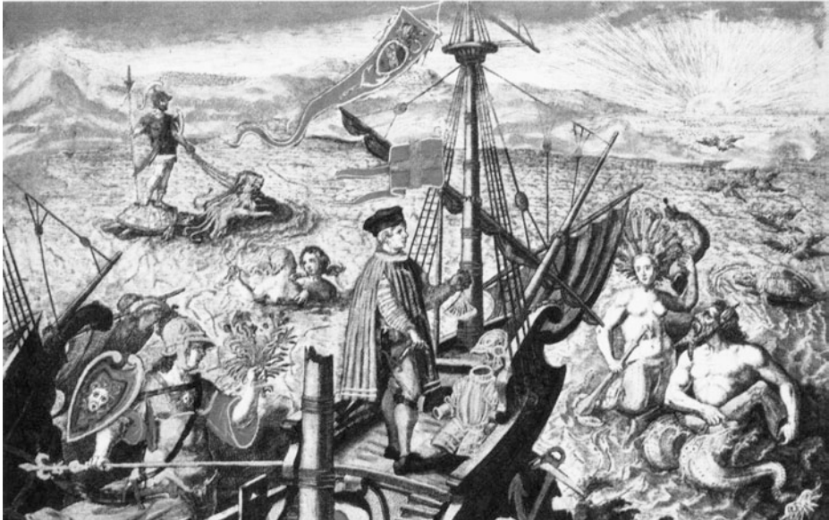
Allegoría de Cristóbal Colon y el descubrimiento de América, por Teodoro Bry, 1594.

La figura del conquistador presenta contraluces muy particulares. En cuanto “adelantado” no es un mero invasor, ni un corsario, ni un colono aunque lo apañe la Corona. Es, sí, un guerrero, pero además de conquistar debe “convertir”: operar en el alma del salvaje, evangelizar. Así, la mística hispánica, comprometida con la fe cristiana, genera una complejidad operativa más allá del oro, del estandarte o del exclusivo beneficio personal.